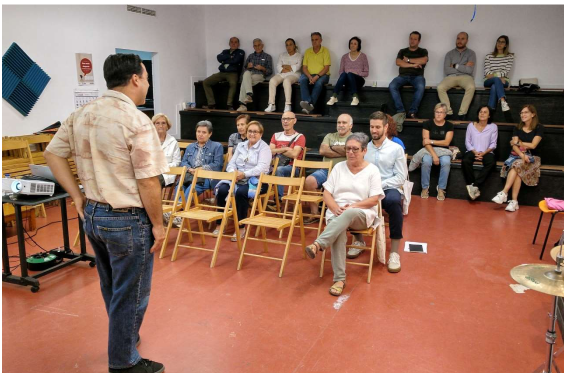
Imagen 1- Asistentes a la sesión