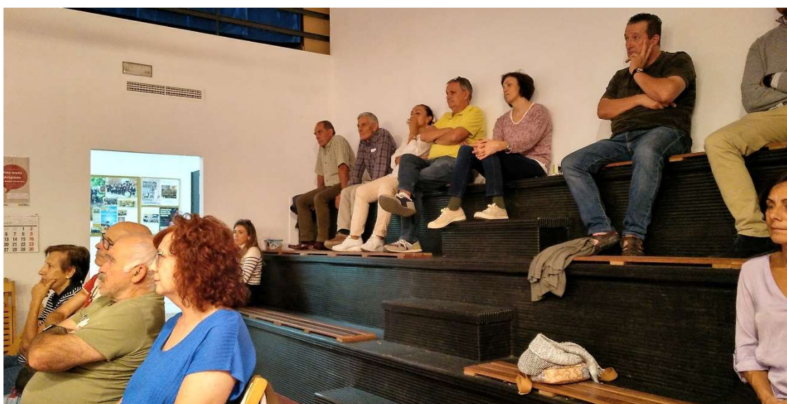
Imagen 4- Asistentes durante el turno abierto de palabras

-Sobre la conservación o no del pajar, se reafirmó el consenso obtenido acerca de su conservación.