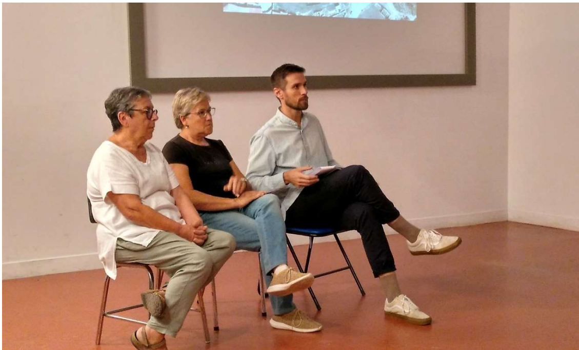
Imagen 3- Exposición de la propuesta de acondicionamiento

contradictorio con otras de las que sí se habían aceptado. Y recalcaron que, desde el principio, se limitó el contenido a tratar al entorno de la nevera, dejando fuera un posible acondicionamiento futuro de la propia nevera.